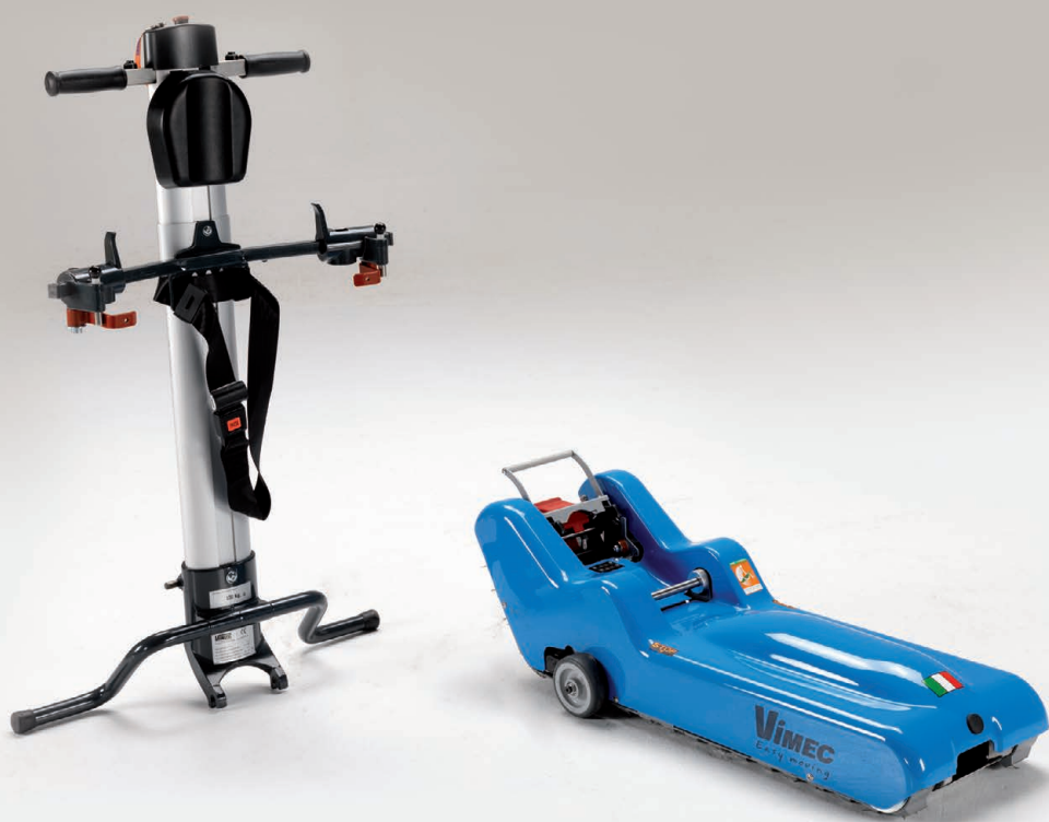
Разбирается на 2 части: штурвал и шасси

T09 Roby разработан для перемещения людей в инвалидных креслах по лестничным маршам всех видов без опасности их повреждения - это достигается благодаря специальным резиновым гусеницам подъемника.