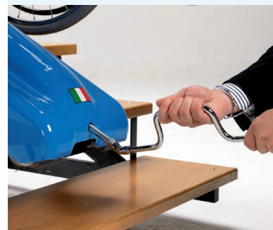
Комплект инструмента для ручного управления