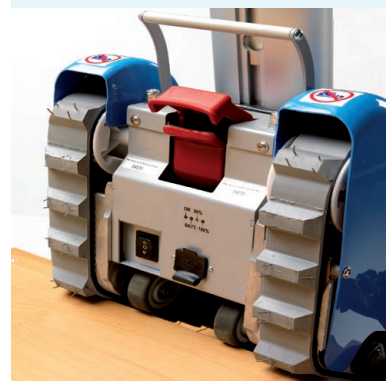
Двойная блокировка (механическая и электрическая)